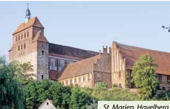
St. Marien, Havelberg

zu seinem Gedicht „Herr von Ribbeck auf Ribbeck im Havelland“ inspirierte. Überall findet man die Birne: