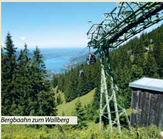
Bergbahn zum Wallberg

Am fünften Tag hatten René und unser Bus frei. Deshalb fuhren wir mit einem örtlichen Busunternehmen nochmal nach München. Eine Gruppe ging mit Roswitha auf einen geführten Spaziergang durch Schwabing und den in unmittelbarer Nähe